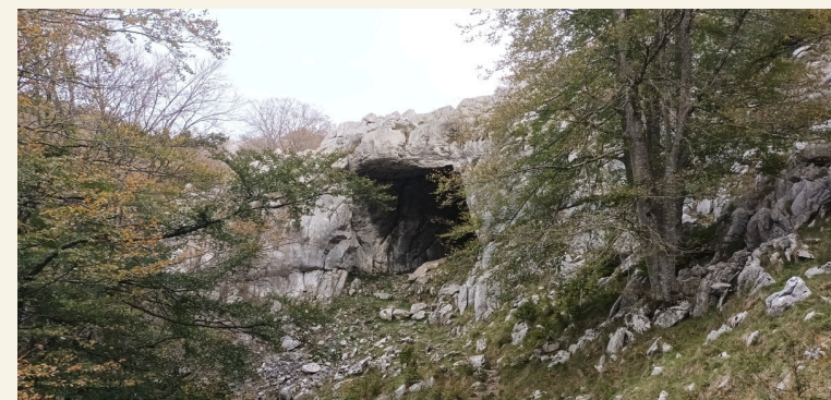
CUEVA DE SUPELEGOR