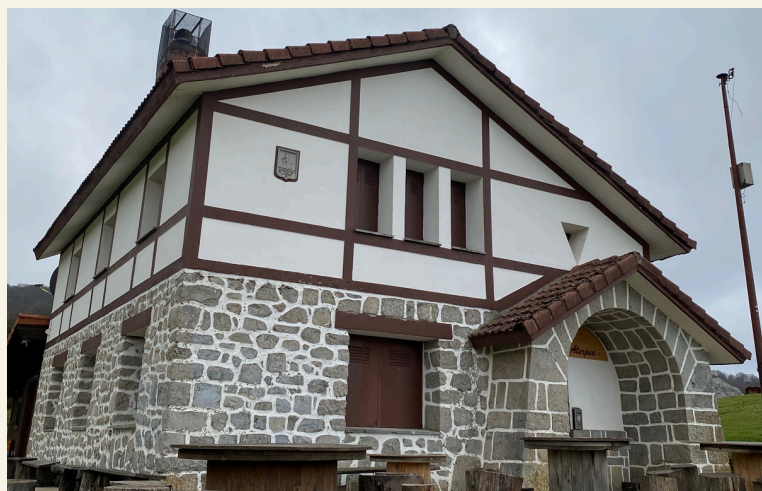
REFUGIO DE GORBEIA